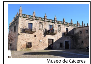
Museo de Cáceres