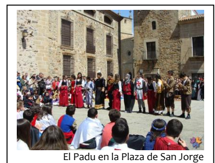
El Padu en la Plaza de San Jorge