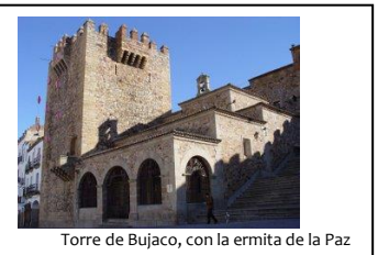
Torre de Bujaco, con la ermita de la Paz