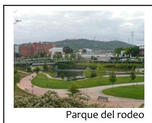
Parque del rodeo